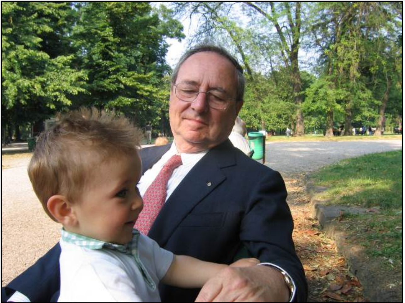
Vado a piedi fino ai giardini e mi metto su una panchina ad aspettare che vengano